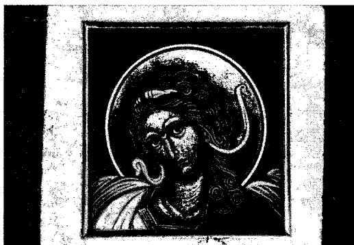
Obrázek: Jedna z ikon Lenky Vlkové.

Bližší informace i cena kurzu budou sděleny průběžně.